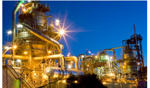
Petróleo y gas